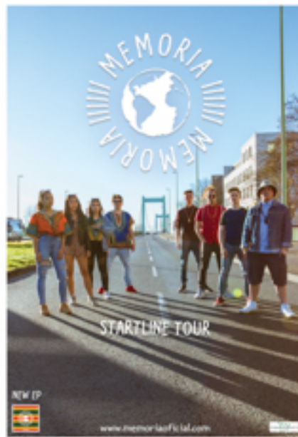
STARTLINE Tour Plakat