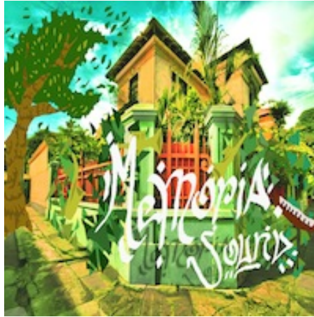
One Drop Single Cover