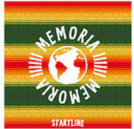
„STARTLINE“ - Album Front Cover